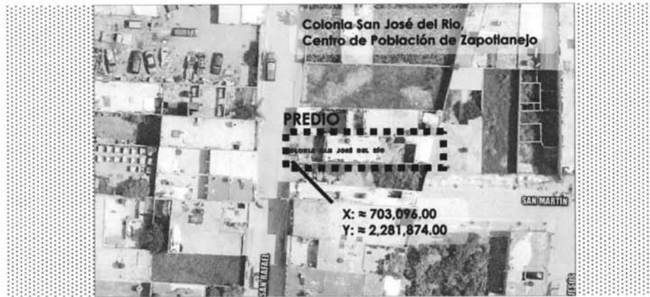
Contexto de localización del predio urbano, colonia Santa Tere, centro de población de Zapotlanejo, Jalisco.

Queda asentado en la presente el extracto de localización del predio Urbano a continuación: