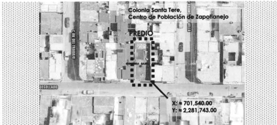
Contexto de localización del predio urbano, colonia Santa Tere, centro de población de Zapotlanejo, Jalisco.

Queda asentado en la presente el extracto de localización del predio Urbano a continuación: