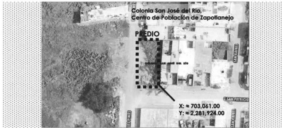
Contexto de localización del predio urbano, colonia Santa Tere, centro de población de Zapotlanejo, Jalisco.

Queda asentado en la presente el extracto de localización del predio Urbano a continuación: