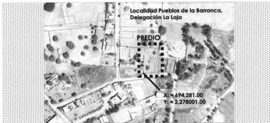
Contexto de localización del predio urbano, localidad La Pueblos de la Barranca delegación de La Laja, Zapotlanejo, Jalisco.

Queda asentado en la presente el extracto de localización del predio Urbano de Propiedad Privada descrita a continuación: