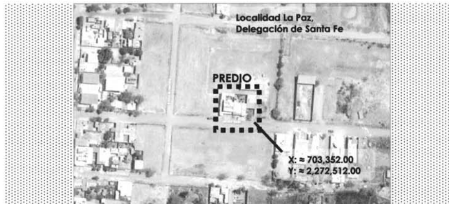
Contexto de localización del predio urbano, localidad La Paz delegación de Santa Fe, Zapotlanejo, Jalisco.

Queda asentado en la presente el extracto de localización del predio Urbano de Propiedad Privada descrita a continuación: