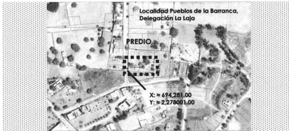
Contexto de localización del predio urbano, localidad la Pueblos de la Barranca delegación de La Laja, Zapotlanejo, Jalisco.

Queda asentado en la presente el extracto de localización del predio Urbano de Propiedad Privada descrita a continuación: