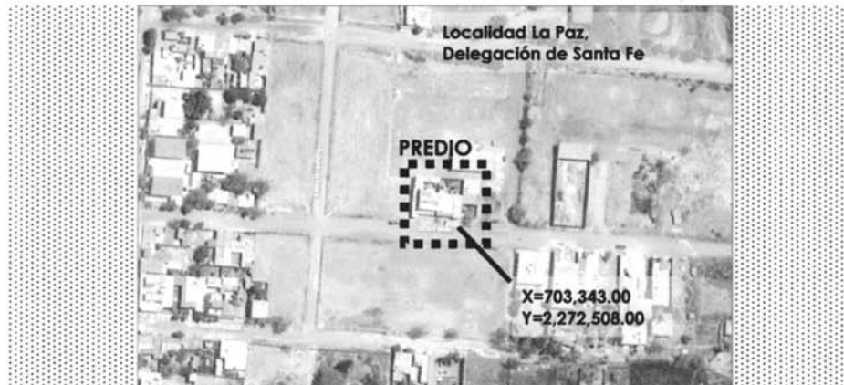
Contexto de localización del predio urbano, localidad la Paz delegación de Santa Fe, Zapotlanejo, Jalisco.

Queda asentado en la presente el extracto de localización del predio Urbano de Propiedad Privada descrita a continuación: