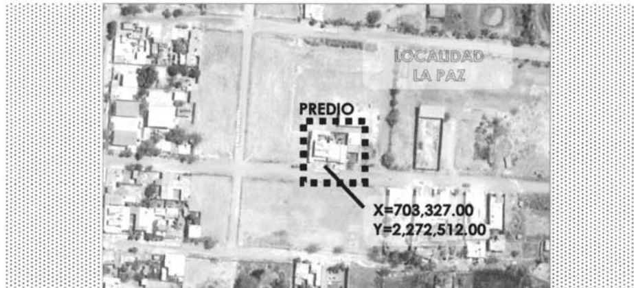
Contexto de localización del predio urbano, localidad la Paz delegación de Santa Fe, Zapotlanejo, Jalisco.

Queda asentado en la presente el extracto de localización del predio Urbano de Propiedad Privada descrita a continuación: